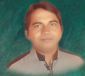
رات پردرد ۾ پيڙجان تو پيو مون مٿان تي لهي شاعري اوچتو (وفا گولو)