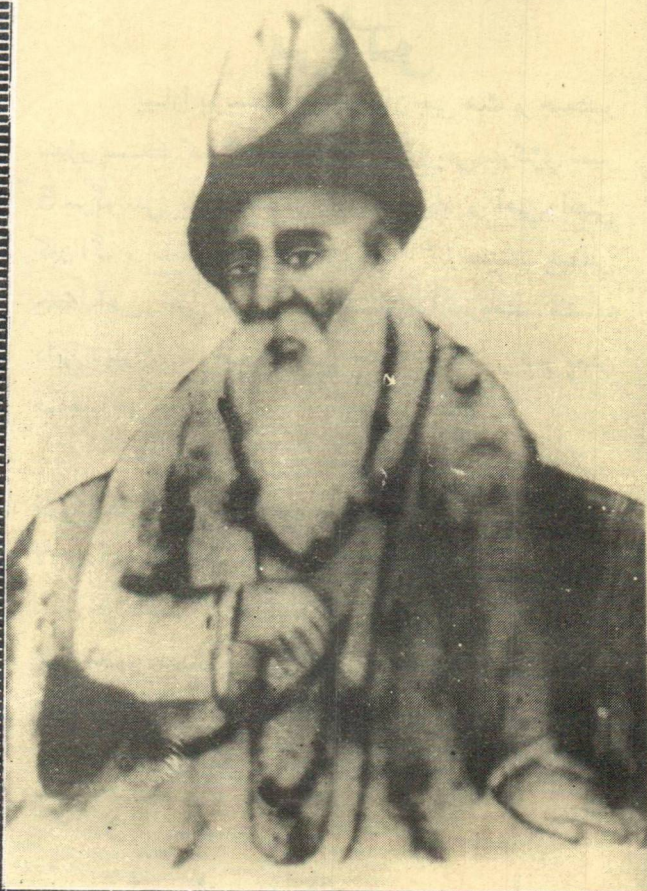
پوج سوامی ہر پجن صاحب سماذا آ شرم شکارپور